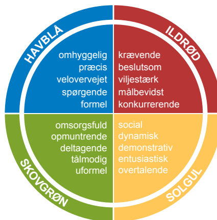
Insights Discovery Wheel: 4 typer

Underholdende og fascinerende introduktion til Insights Discovery – som bider sig fast.